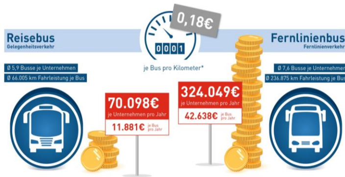
Mehrkosten einer Busmaut pro Busunternehmen

Eine Hauptbegründung für die Forderung nach einer Busmaut ist der angeblich unfaire Wettbewerb zwischen Bus und Bahn. Schließlich zahlen Züge ja eine Schienen-Maut und der Bus nicht. Dabei unterscheiden sich die Abgaben- und Finanzierungssysteme stark. Das Umweltbundesamt stellt fest, „dass die öffentliche Hand bei der Straße 90 Prozent der Einnahmen aus verkehrsspezifischen Steuern und 10 Prozent aus direkten Nutzerabgaben (Lkw Maut) generiert, während das Verhältnis zwischen direkt von den Nutzern der Infrastruktur zu leistenden Abgaben und verkehrsspezifischen Steuern bei der DB umgekehrt ist.“ Laut Umweltbundesamt decken Fern- und Reisebussen die ihnen zurechenbaren Infrastrukturkosten zu mehr als 130 Prozent.