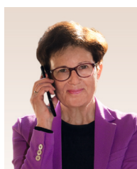
Gudrun Brendel-Fischer Integrationsbeauftragte der Bayerischen Staatsregierung